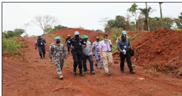
Visite du site devant abriter la FPU3 Rwanda