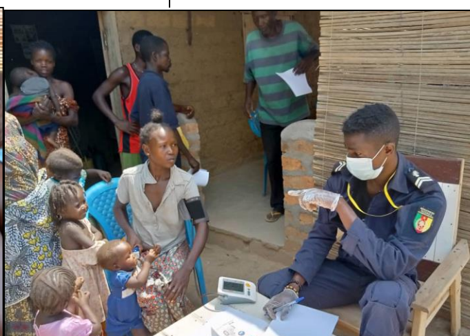
Campagne de consultation et soins gratuits organisée par la FPU2 Cameroun à Bangui

Au total 124 personnes ont été consultées dont 47 hommes, 51 femmes et 26 enfants et des médicaments adéquats répondant aux pathologies de chaque patient leurs ont été offerts. Par ailleurs, Cinq mille (5000) litres d'eau potable ont été également distribués à la population.