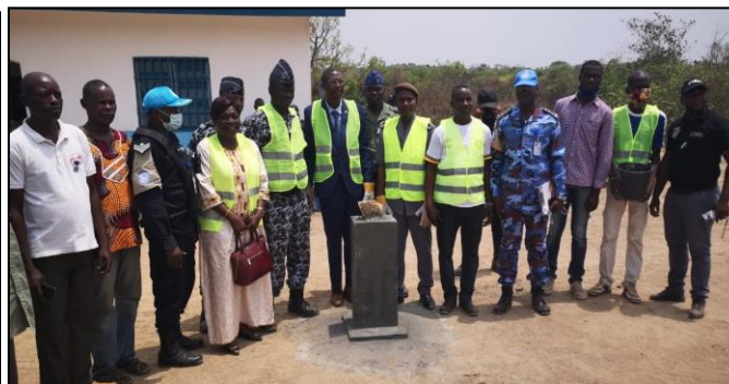
Cérémonie de Pose de la pierre pour la construction d'un forage et de la clôture au commissariat de Damara

Toujours à Damara, les 12 et 13 et 26 février 2022, les UNPOL en colocation au Commissariat de DAMARA, se sont rendus dans les villages Kavingo et Libby pour sensibiliser les habitants sur la sécurité et les problèmes liés à la transhumance.