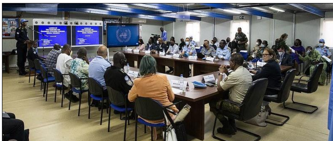
Les participants au séminaire sur les violences sexuelles à la base logistique MINUSCA à Bangui

objectif d'informer et de sensibiliser le personnel en uniforme sur les stratégies de prévention des violences sexuelles.