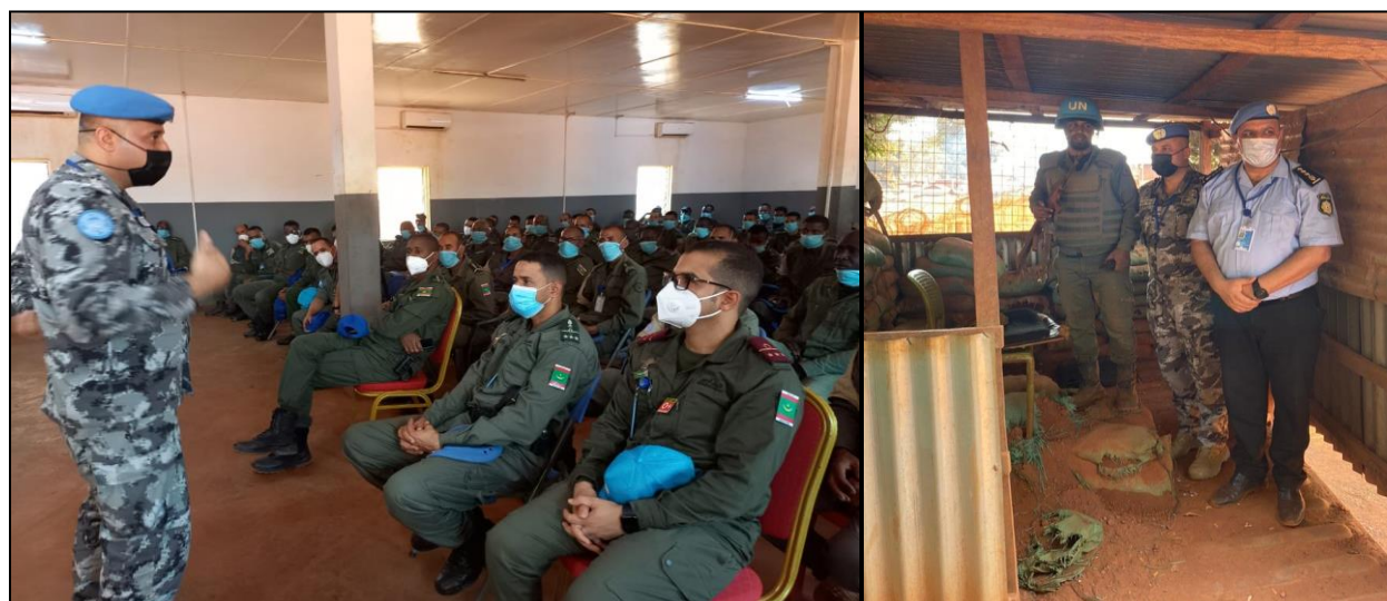
Echanges avec la FPU2 Mauritanie et visite de ses installations à Bria

professionnalisme et sans relâche sa tâche dans le cadre de la mise en œuvre du Mandat de la MINUSCA.