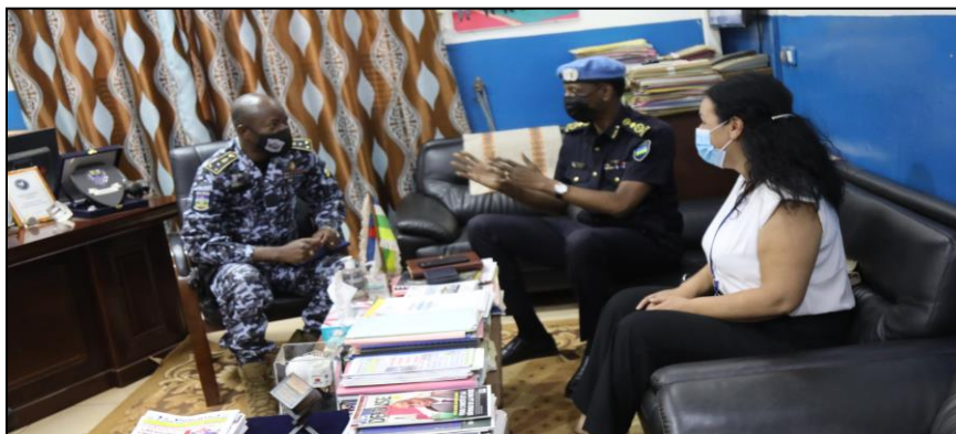
Echanges entre le chef UNPOL, le DG Police et la chef de section Droits de l'homme de la MINUSCA

Précédemment le 02 février, le Chef de la Police de la MINUSCA s'était rendu à l'Ecole Nationale de Police au PK10. Après les échanges avec les responsables de ladite structure sur les relations de travail, il a visité les projets réalisés par UNPOL au profit de cette école.