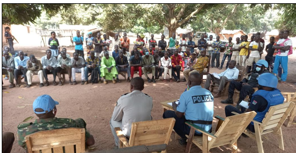
UNPOLs sensibilisent les habitants de Damara sur la sécurité et les problèmes liés à la transhumance

Toujours à Damara, les 12 et 13 et 26 février 2022, les UNPOL en colocation au Commissariat de DAMARA, se sont rendus dans les villages Kavingo et Libby pour sensibiliser les habitants sur la sécurité et les problèmes liés à la transhumance.