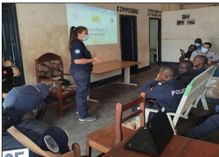
Formation en analyse du renseignement

du renseignement ; la collecte de données fiables et complètes ; l'élaboration de statistiques et de rapports analytiques et sur l'importance de l'analyse criminelle ont montré leur intérêt à pouvoir s'approprier ces thématiques pour mieux appréhender la criminalité dans leurs zones de compétence respectives en vue d'une protection plus efficace de la population civile.