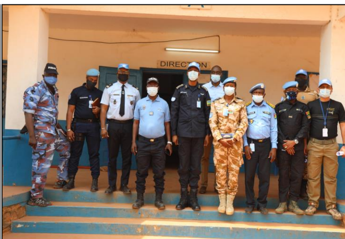
Le Chef UNPOL et sa délégation avec le personnel de l'école nationale de Police