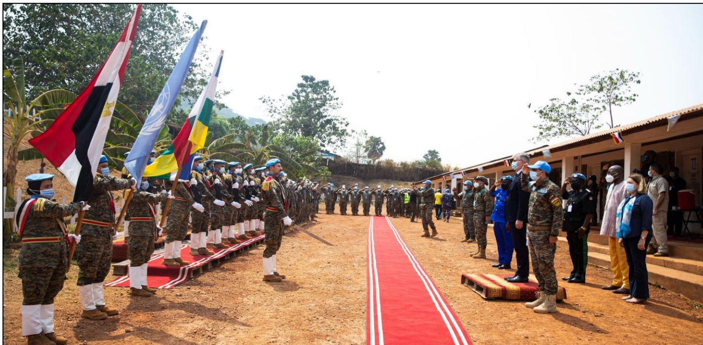
Arrivée du SG des Nations Unies aux opérations de paix Jean-pierre LACROIX à la FPU Egypte

rendu le 27 février, à la base de l'Unité de Police Constituée (FPU) de l'Egypte au camp Fidel.