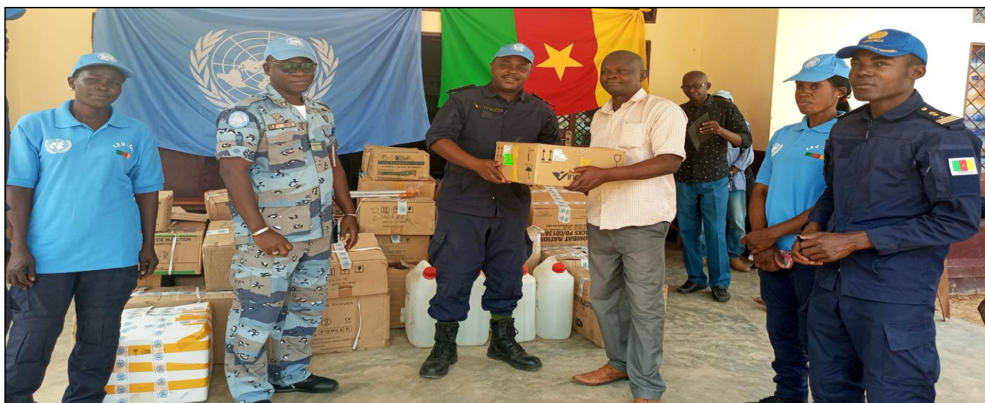
Don de médicaments au district sanitaire de Bouar

d'améliorer les conditions de santé des populations. A cette occasion, le district de santé de Bouar-Baoro a bénéficié d'un don de médicaments et autres consommables médicaux.