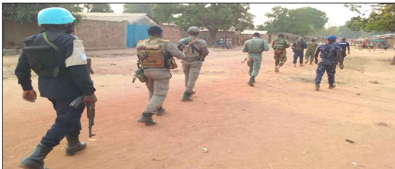
Opération de sécurisation à Ouandago dans la préfecture de la Nana-Gribizi

trafricaine. Cette opération a été initiée à la suite des violences répétitives exercées sur la population par des éléments de groupes d'auto-défense dans cette localité.