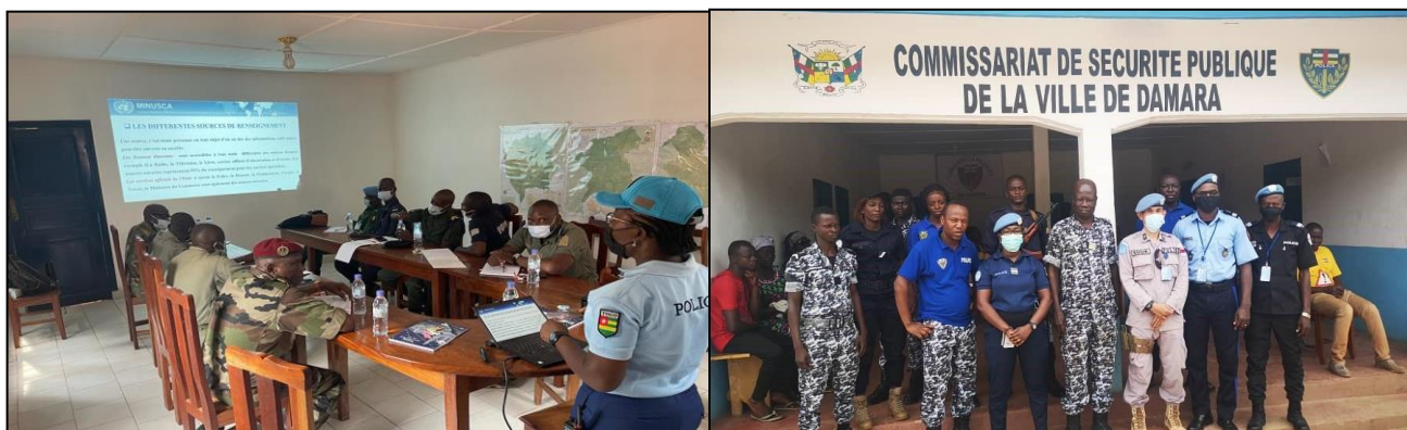
Séances de formation des FSI sur le recueil et l'exploitation du renseignement

55 femmes ont bénéficié du MMA (Mentoring Monitoring et Advising) en matière de recueil du renseignement, des statistiques et d'Analyse de la criminalité.