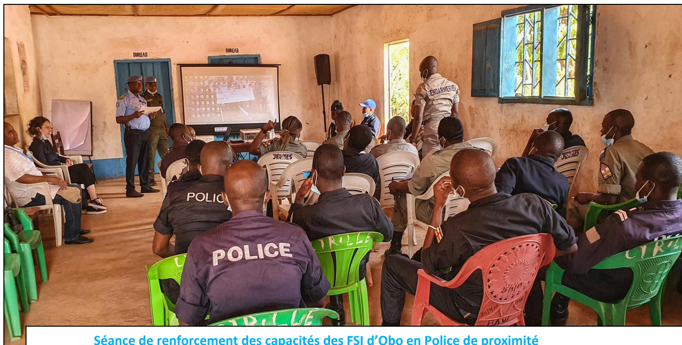
Séance de renforcement des capacités des FSI d'Obo en Police de proximité

A la Maison des Jeunes à OBO (Est-RCA), une formation en Police de proximité s'est déroulée du 28 mars au 02 avril 2022 au profit de 22 personnels des Forces de Sécurité Intérieure.