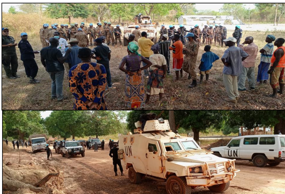
Installation d'une base opérationnelle temporaire à Linguiri par UNPOL et la Force MINUSCA

Toujours à Kaga-Bandoro, précisément à Linguiri (120 km) une base opérationnelle temporaire