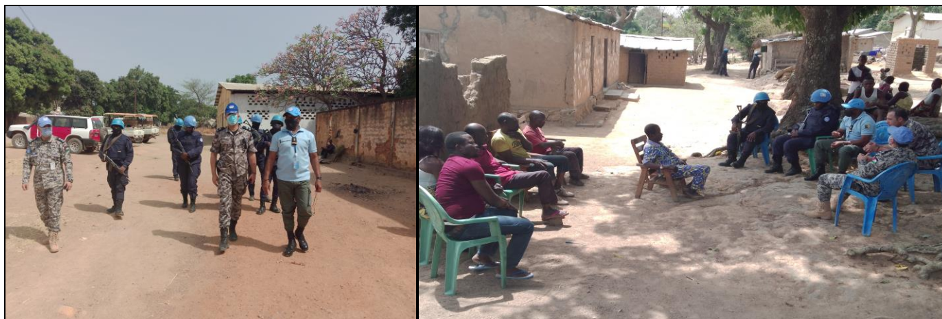
Patrouille et interaction avec la population par les UNPOLs de Bouar

des activités génératrices de revenus. Cette activité s'est déroulée sous la couverture sécuritaire de la 1ère Unité de Police Constituée du Cameroun.