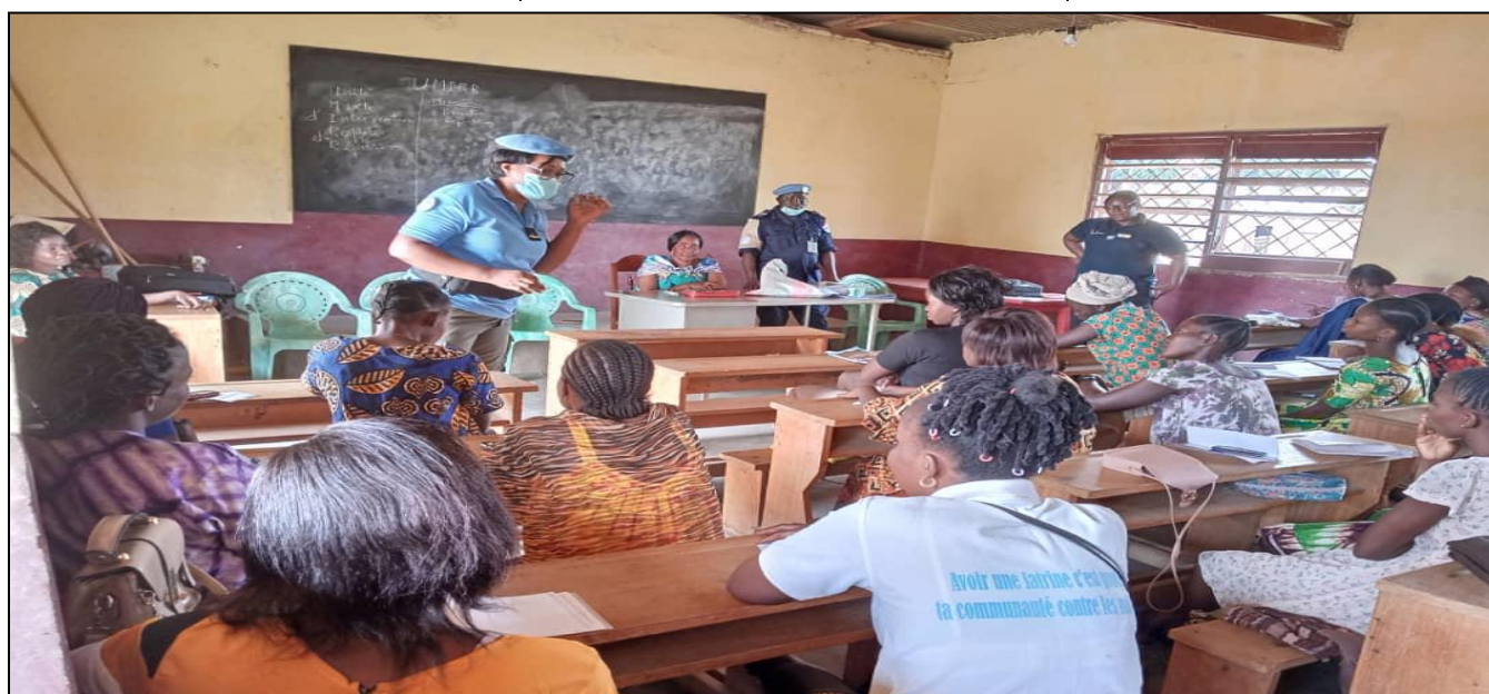
Unpol de Bouar en pleine séance de sensibilisation des jeunes filles à l'occasion de la journée de la femme

des séances de sensibilisation des jeunes filles de la localité.