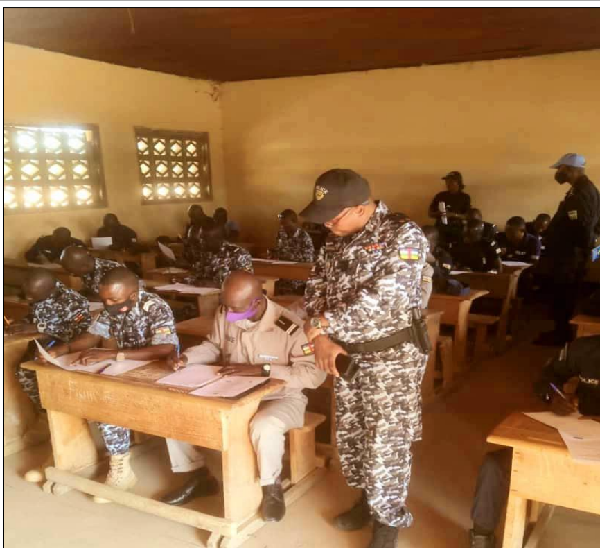
Test de sélection des FSI en vue de la formation d'officiers de Police Judiciaire

Le test de sélection de deux cents (200) Officiers de Police Judiciaire des FSI s'est tenu le 27 février, dans les 10 centres de composition retenus sur l'ensemble du territoire centrafricain. Organisé conjointement par la coordination de la Formation UNPOL et le PNUD, ce test permettra dans les prochains mois, la formation des candidats retenus en vue de renforcer les capacités des acteurs de la chaîne pénale en matière de procédure d'enquête. Au total 658 candidats ont répondu présents dans les centres d'écrits dont 55 femmes.