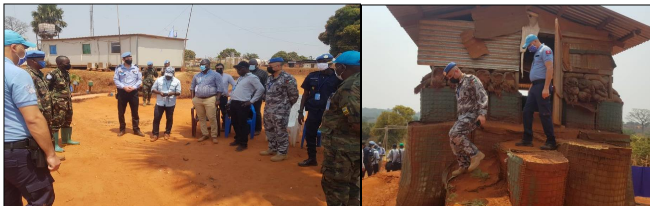
Echanges et visites des installations lors de la visite du chef d'Etat-major UNPOL a Berberati

lièrement dans les bases de la FPU2 Sénégal et du Bataillon Tanzanien, où ils ont échangé avec les deux Commandants d'Unités sur les difficultés opérationnelles et logistiques auxquelles ils sont confrontés.