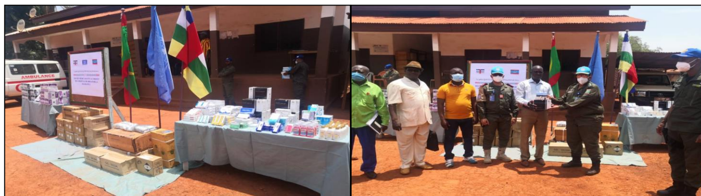
La FPU2 Mauritanie offre des médicaments à l'hôpital régional de Bria

mables médicaux) à l'hôpital régional de ladite localité.