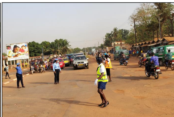
Régulation de la circulation par les femmes FSI/UNPOL à l'occasion de la JIF organisée par les FSI

Toujours dans le cadre des activités commémoratives de cette journée, la section genre et le réseau des femmes de la Police de la MINUSCA se sont rendus le 19 mars 2022 à Boali (53