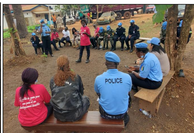
Causerie débat avec les FSI à l'occasion de la JIF organisée par le pool gender UNPOL

Parallèlement dans le cadre de cette journée et sur invitation des personnels féminins des FSI, les femmes UNPOL se sont rendues le