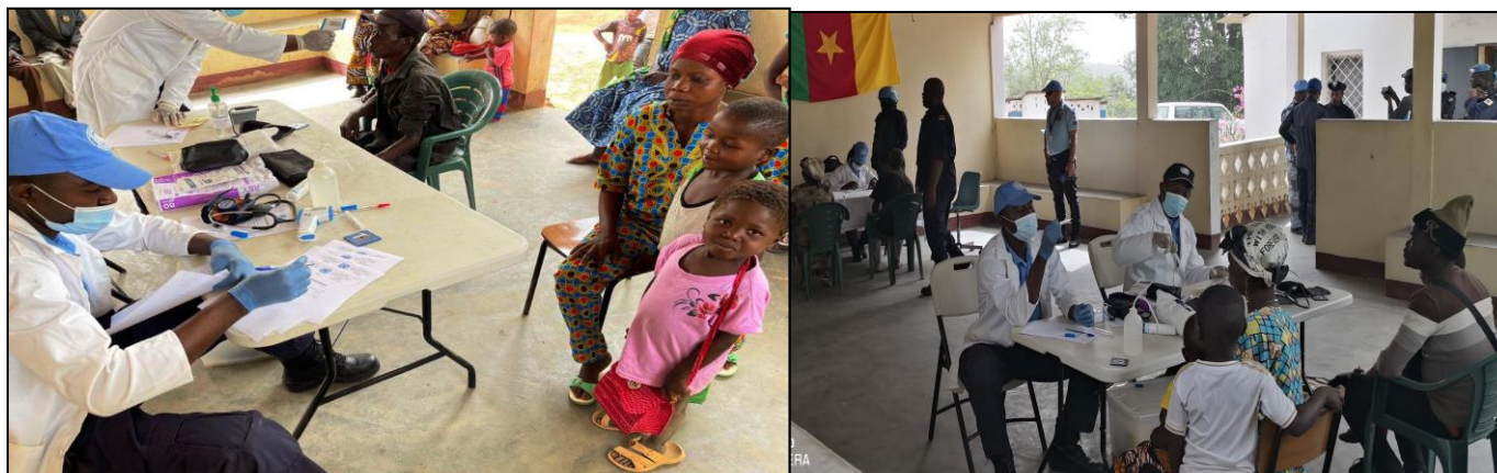
Campagne de consultation organisée par la FPU1 Cameroun à Bouar

La 1 ère Unité de Police Constituée du Cameroun (CamFPU1) a organisé, le 17 mars 2022, une campagne médicale au dispensaire « Enfant Jésus de Yole » à l'attention des populations des localités de Yole, Bwabouziki et Ndalle situées dans la périphérie de Bouar.