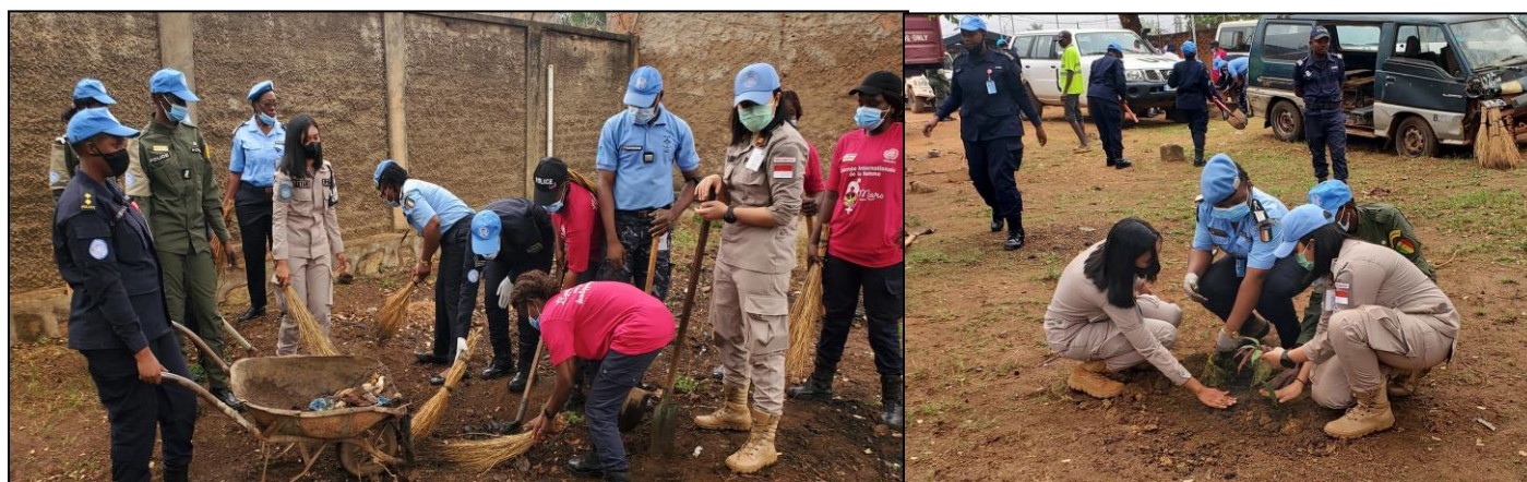
Activité de salubrité et reboisement au 6 e arrdt organisés par le pool gender UNPOL à l'occasion de la JIF

c'est le Commissariat de Police du 6 e arrondissement qui a servi de cadre pour le démarrage des activités de salubrité et de reboisement le 11 mars 2022.