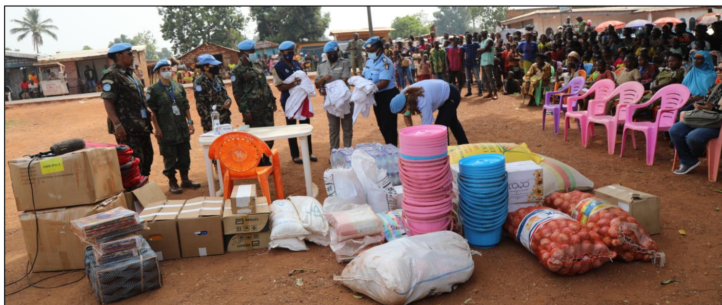
Dons de vivres, produits pharmaceutiques et autres matériels à Boali à l'occasion de la JIF

MINUSCA, et a permis de soutenir les personnes vulnérables de cette localité. L'activité s'est déroulée en présence des autorités locales de Boali.