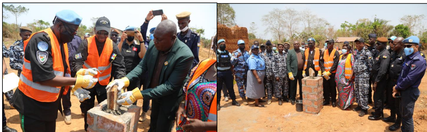
Pose de la pierre et photos de famille lors du lancement des travaux de construction du commissariat de Bimbo

d'exécution de 16 mois, vient en appui au renforcement des capacités opérationnelles des Forces de Sécurité Intérieure et soutenir l'extension de l'autorité de l'État sur toute l'étendue du territoire de la République centrafricaine.