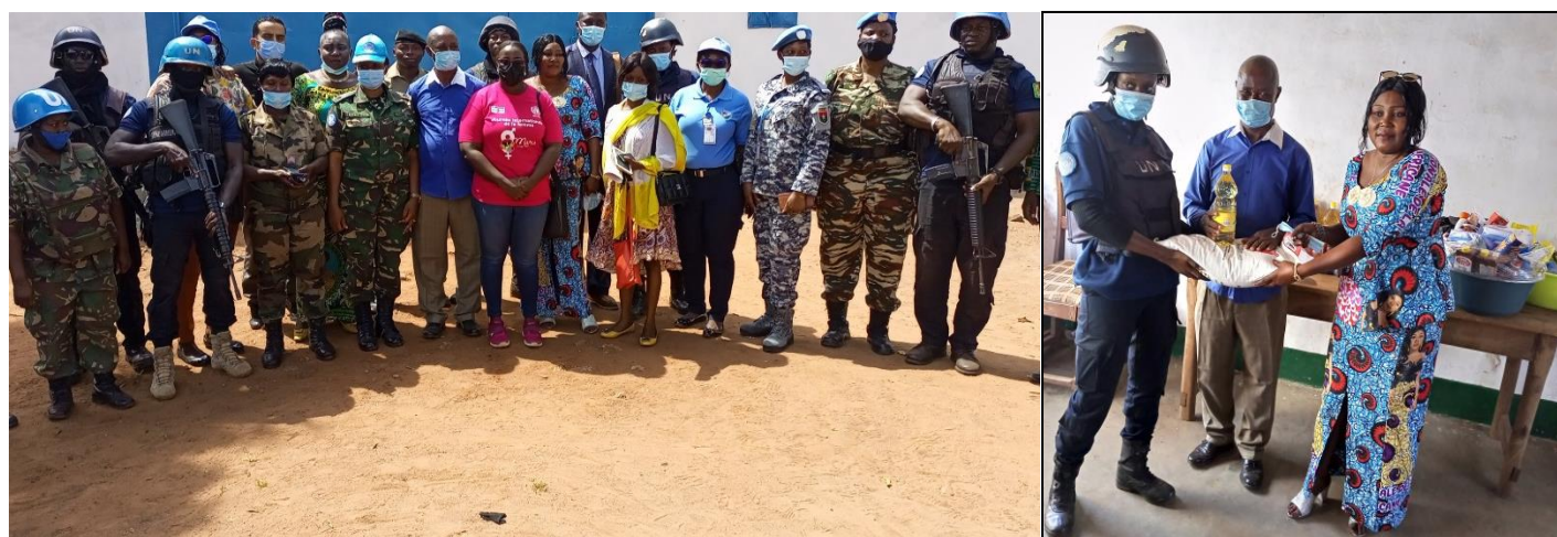
UNPOL et les autres sections de la MINUSCA de Berberati ont fait don de kit alimentaire à la maison d'arrêt et de correction de la localité

Dans le même sens, le 09 mars à Berberati , UNPOL conjointement avec les autres sections de la MINUSCA ont fait don de kits alimentaires et hygiéniques aux détenus de la maison d'arrêt et de correction de Berberati.