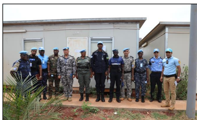
Photo de famille avec les UNPOLs de Bangassou