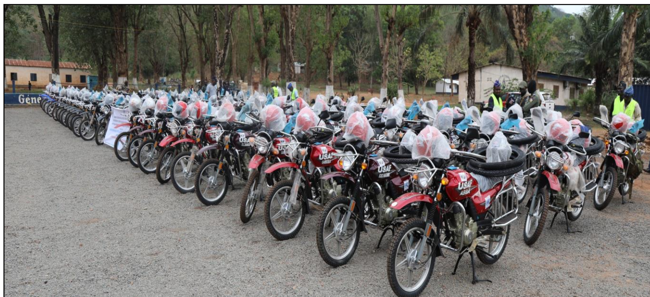
Les 80 motos destinées aux unités opérationnelles des Forces de Sécurité Intérieure

Le 11 mars 2022, a eu lieu à la place d'armes au camp Izamo à Bangui, la cérémonie de remise de quatre-vingts motos destinées d'une part aux Unités FSI et d'autre part aux Unités Spéciales Anti-Fraude de la RCA.