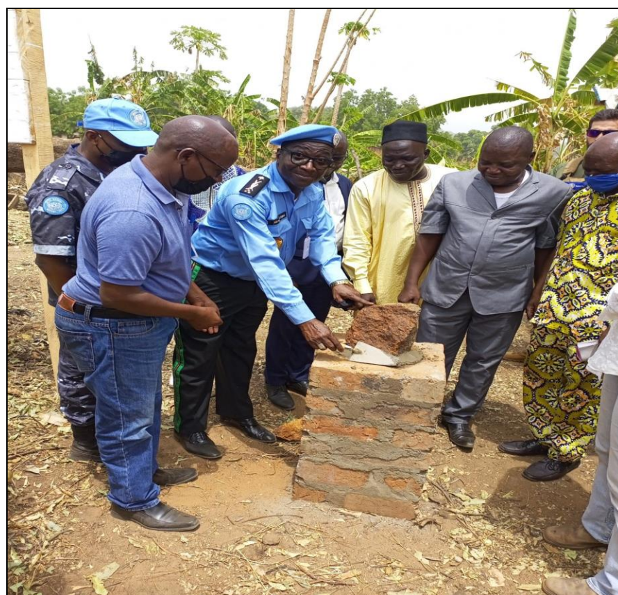
Pose de la 1ere pierre pour la construction du commissariat de Ndele