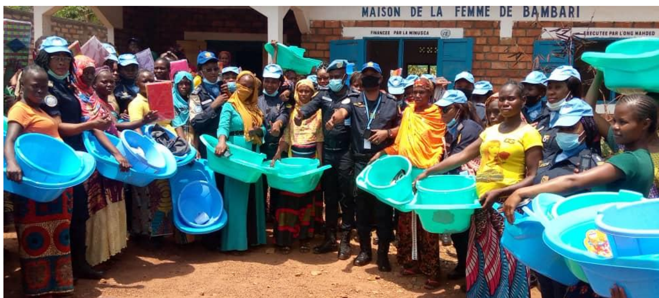
Dons de bassines, pagnes...par le personnel féminin de la FPU Congo-Brazza à Bambari

son de la femme en présence de la présidente de l'Organisation des Femmes Centrafricaines (OFCA).