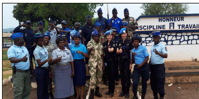
Formation des FSI sur la gestion d'une scène de crime par l'équipe PTS UNPOL