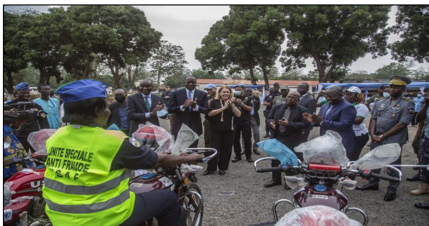
Le leadership MINUSCA suivant la démonstration du bon fonctionnement des motos

centrafricains de l'Intérieur et de la Sécurité Publique, et de celui en charge de l'Energie et des Ressources Hydrauliques.