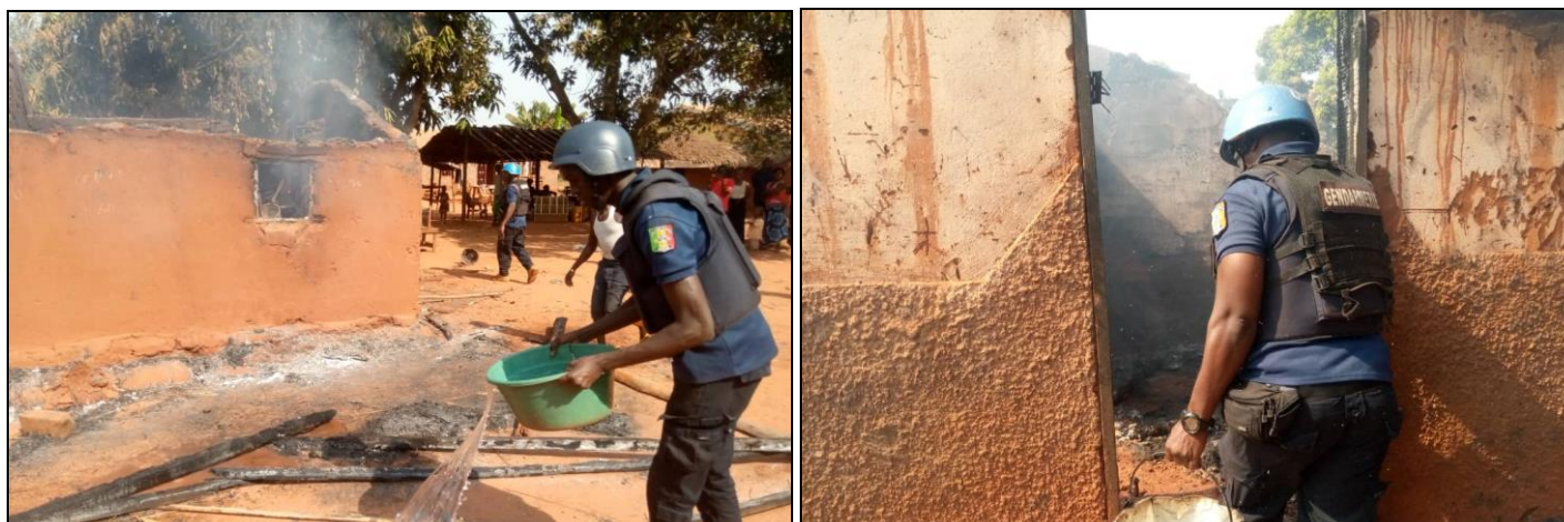
Les éléments de la FPU2 Sénégal éteignant un incendie à Berberati

des vies. Le commissariat de Police de Berberati a été saisi pour effectuer les constatations d'usage avec l'assistance technique d'UNPOLs de Berberati.