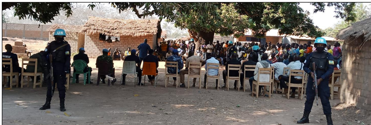
Opération de sécurisation à Ouandago

tions ; la saisie des armes de fabrication artisanale et autres matériels.