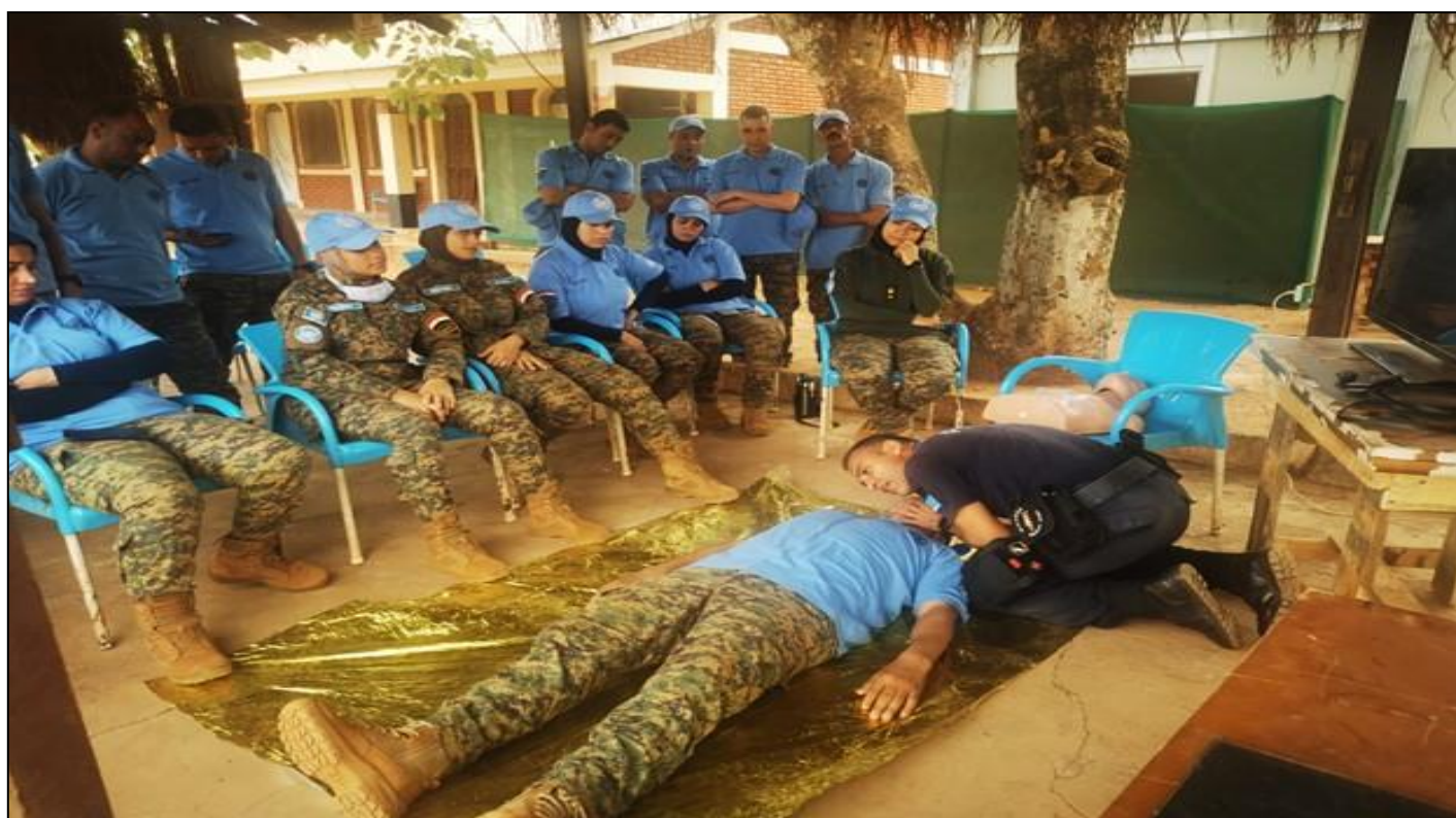
Formation en secourisme opérationnel et protection des hautes personnalités