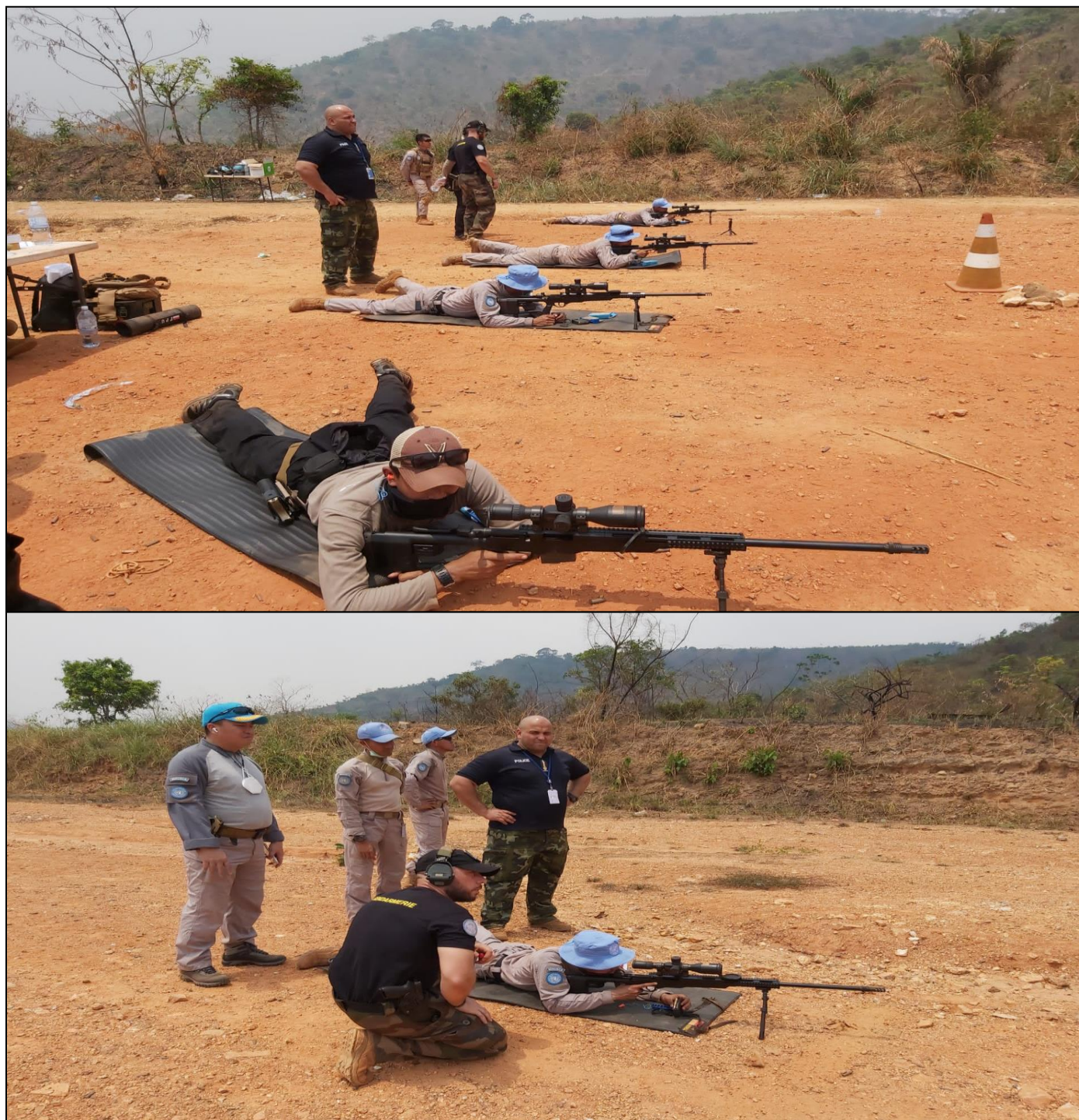
Séance de tir organisée par la coordination de formation des FPU/PSU

cement de capacités ont été menées, en Techniques de Protection Rapprochée, secourisme opérationnel et Tir.